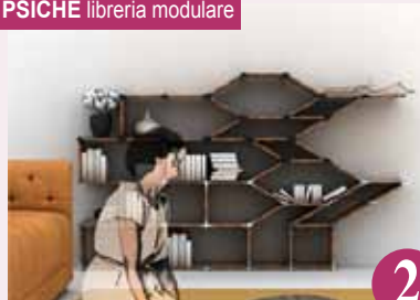
PSICHE libreria modulare